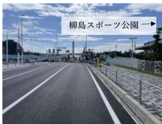
(令和4年8月30日(火) 撮影)