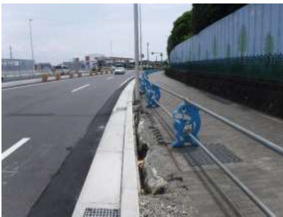
（令和4年7月21日（木）撮影）