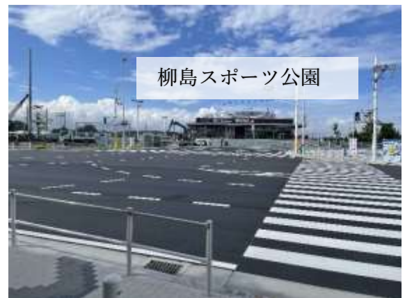
（令和4年8月30日（火）撮影）