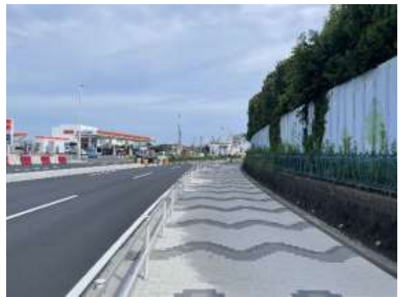
（令和4年8月30日（火）撮影）