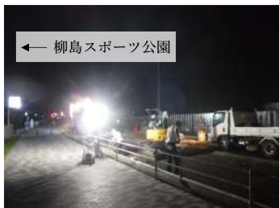
(令和4年8月1日(月) 撮影)