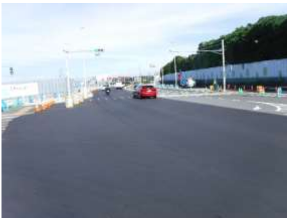
（令和4年7月25日（月）撮影）