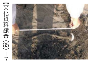
巣穴の型取り作業