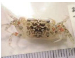
ナンヨウスナガニ(幼体)

てきたものが海岸に定着し、水温が温かい時期に生育した後、冬季に死滅すると考えられます。日中は周囲を警戒して巣穴にいることが多く、地上に出ても、すぐに巣穴に戻ります。夜間になると巣穴を出て、活発に活動